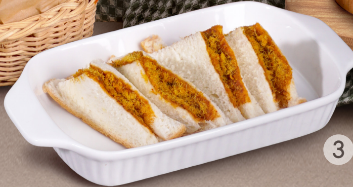
หมูหยองเบเกอรี่ ส.ขอนแก่น